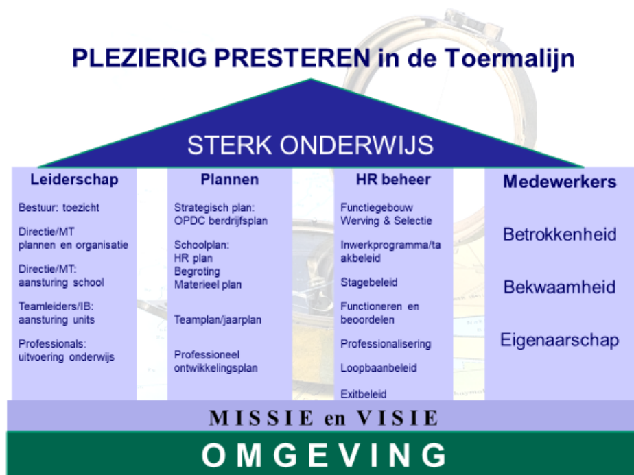
Figuur 3: Plezierig Presteren in de Toermalijn

Volgens onderstaand schema is in de afgelopen jaren het personeelsbeleid binnen de Toermalijn ingevuld en uitgevoerd. Sinds 2016 wordt de inpassing in het Strategisch Personeelsbeleid binnen QliQ-Primair stap voor stap gerealiseerd. Aansluitend bij het Koersplan QliQ ontwikkelt zich dit belangrijke deelgebied verder.