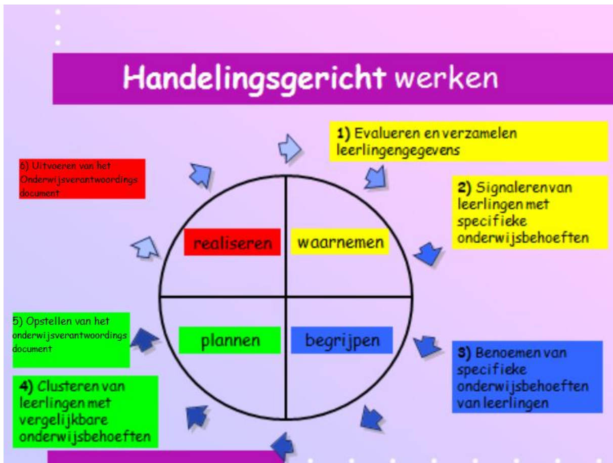
Figuur 2: Handelingsgericht werken

Groepsleerkrachten zijn verantwoordelijk voor bovenstaand proces en passen hun klassenmanagement hierop aan. Tijdens de uitvoering van de (groeps)activiteiten vinden er klassenbezoeken plaats door de intern begeleider en/of teamleider, teneinde zicht te hebben op en/of de leraren te begeleiden bij het doelgericht uitvoeren van geplande activiteiten en bij het afstemmen van hun instructie, aanbod, onderwijstijd en klassenmanagement op de onderwijsbehoeften van de leerlingen. Streven naar kindgericht in het onderwijs betreft de leerling zelf hier nadrukkelijk in.